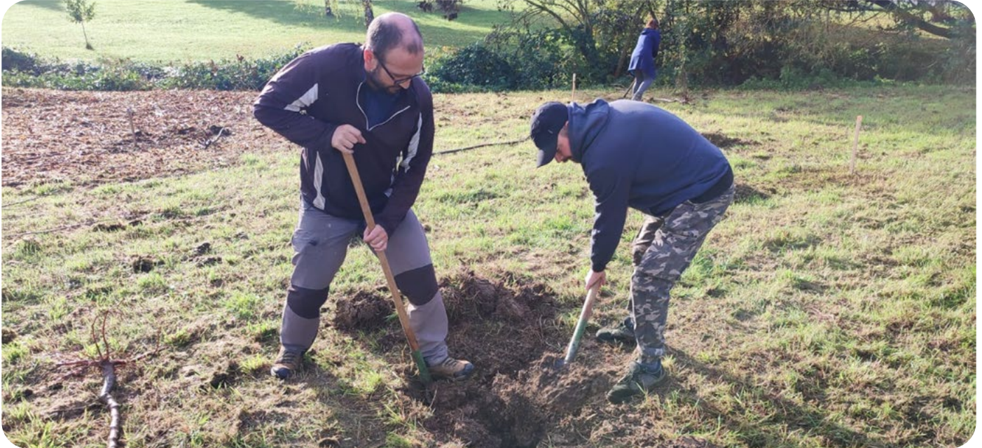
Výsadba v obci Dolný Pial

Anotácia k podporenému projektu: Občianske združenie Gemerské grúne zrekultivuje starý extenzívny sad na okraji gemerskej obce Babinec a vysadí v ňom 40 ks ovocných stromov. Ide o odrody jabloní a hrušiek, ktoré sa v sade pôvodne pestovali. Súčasťou výsadby bude aj ovocinársky workshop zameraný na výsadbu a ošetrovanie stromov. Projektom má vzniknúť malebné miesto, plné ovocia, ktoré bude lákať verejnosť k tráveniu voľného času a priblíži ovocinársku tradíciu regiónu.