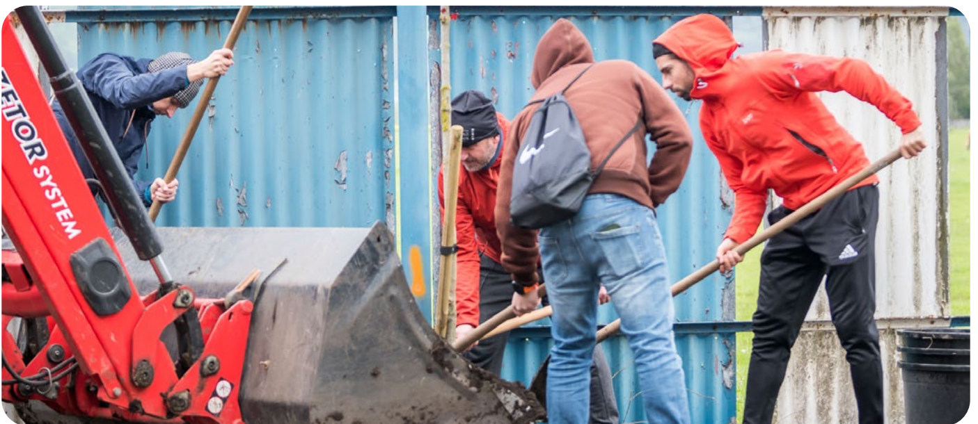
Prvá výsadba stromčekov a kríkov zamestnancami skupiny Tipsport v obci Žabokreky