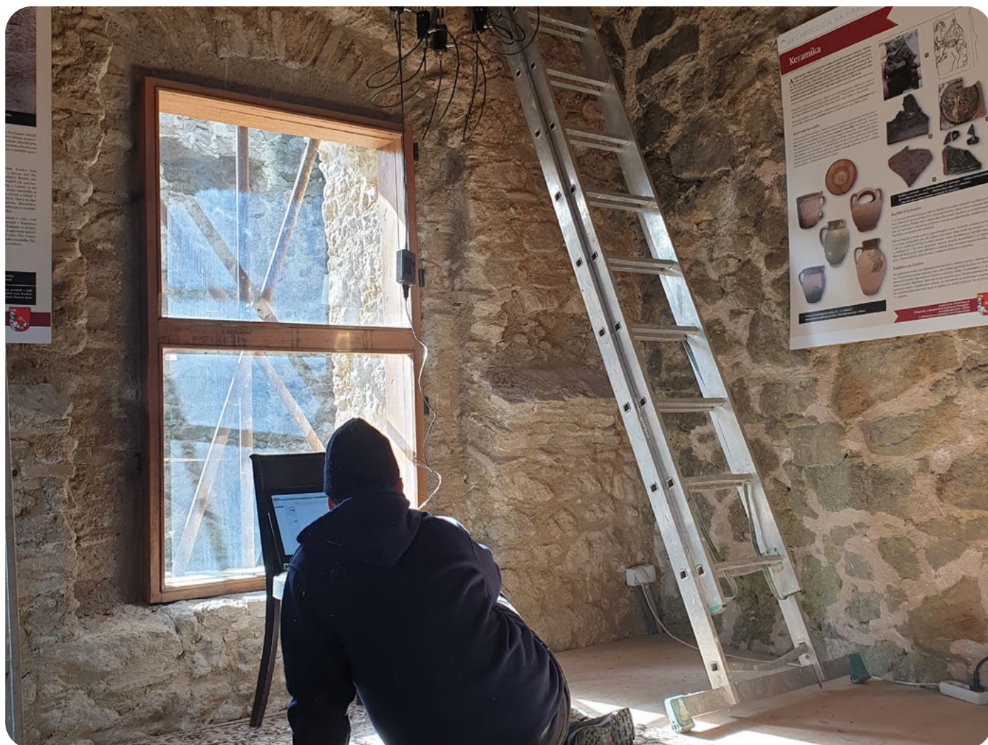
Obnova Lietavského hradu