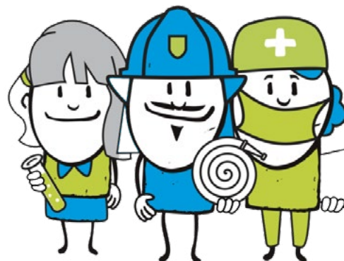
Zamestnanecký grantový program Nadácie Tipsport „Hľadáme 3 stotočných“