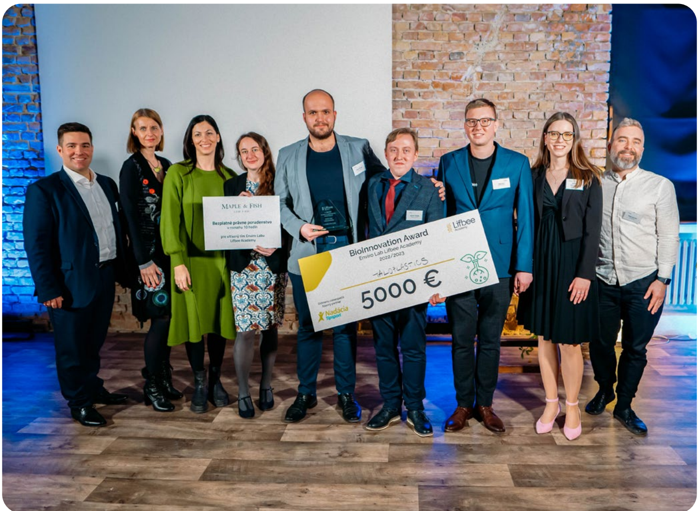
BioHive, o.z. – Víťazný tím kategórie Enviro preberá cenu, foto: Samuel Sedliak

Anotácia k podporenému projektu: Slovenská ornitologická spoločnosť/BirdLife Slovensko je mimovládna organizácia, občianske združenie, ktorého hlavným poslaním je ochrana a výskum prírody, najmä voľne žijúceho vtáctva a jeho biotopov. Zastupujeme našu krajinu v medzinárodných organizáciách: BirdLife International, Euring, Association of European Rarities Committees. Pri napĺňaní poslania sa spoločnosť venuje predovšetkým ochrane druhov, biotopov a území, ochranárskemu výskumu vrátane krúžkovej činnosti, environmentálnej politiky, environmentálnej výchovy, venujeme sa práci s deťmi a mládežou, vydavateľskej činnosti a tiež organizujeme semináre a konferencie. Vydávame odborný časopis Tichodroma a vedecko-populárny časopis Vtáky (do roku 2006 pod názvom Vtáčie správy). Naše projekty sú zamerané na ochranu druhov, biotopov, území a na spoluprácu s ľuďmi. Našími členmi sú ľudia rôznych profesií a veku, ktorých spája láska k prírode a vtáctvu.